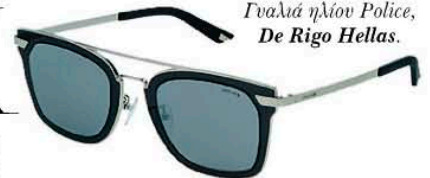
Γυαλιά ηλίου Police, De Rigo Hellas.