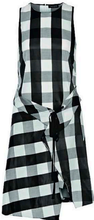
Φόρεμα, Rag & Bone.

Το κλασικό καρό, στην ανανεωμένη εκδοχή του, λατρεύει το μαύρο και το κόκκινο χρώμα και επαναπροσδιορίζει το στυλ με νοσταλγικό, αλλά άκρως εντυπωσιακό τρόπο.