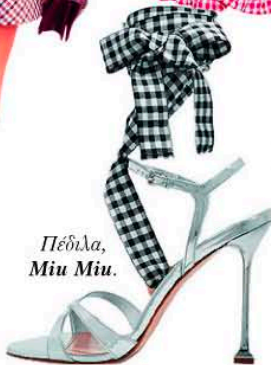
Πέδιλα, Miu Miu.

Το κλασικό καρό, στην ανανεωμένη εκδοχή του, λατρεύει το μαύρο και το κόκκινο χρώμα και επαναπροσδιορίζει το στυλ με νοσταλγικό, αλλά άκρως εντυπωσιακό τρόπο.