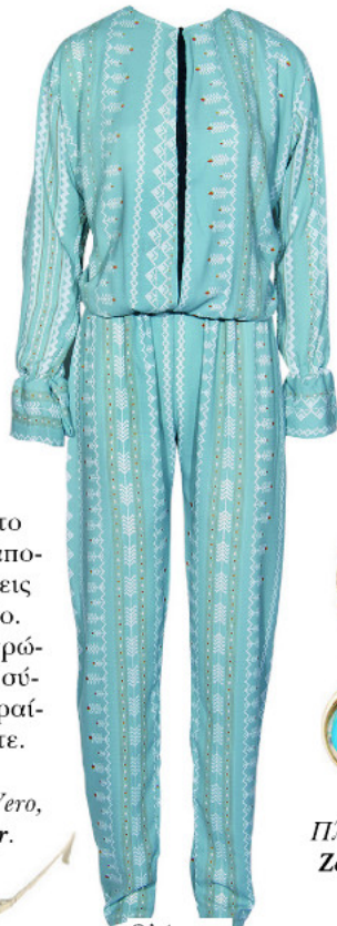
Ολόσωμη φόρμα, Gusto Vassilis .

Μοναδικό και φτωτεινό, το απαλό μπλε και το βεραμάν αποτελούν τις ιδανικές αποχρώσεις για την καλοκαιρινή περίοδο. Συνδυάστε τις με γήινες αποχρώσεις που θα προσφέρουν στα σύνολά σας ηρεμία και την απαραίτητη ζωντάνια που επιθυμείτε.