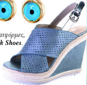
Πλατφόρμες, Zak Shoes .

Η παλέτα των παστέλ χρωμάτων δίνει την αίσθηση αρμονίας και γαλήνης που ταιριάζει απόλυτα στη σεζόν. Με ρομαντικό χαρακτήρα και χαρούμενα χρώματα, το μπλε, το ροζ και το βεραμάν θα κλέψουν τις εντυπώσεις.