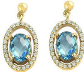
Σκουλαρίκια, Al'Oro .