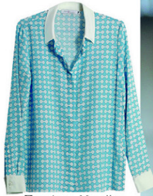
Πονκάμσο Μουτζιαν, www.mourjjan.com .