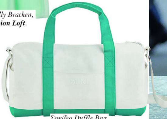
Σακίδιο Duffle Bag Mini, Spanos