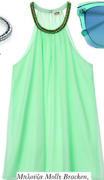
Μπλούζα Molly Bracken, 2803 Fashion Loft .