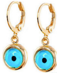
Νίκελ free επίχρυσια σκουλαρίκια με μπλε ματάκι €18, www.bijoubijou.com .