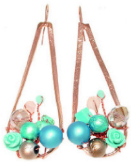
Σκουλαρίκια Catherine Bijoux, www.catherinebijoux.com .