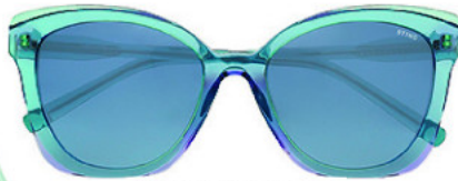
Γυαλιά ηλίου Sting, De Rigo Hellas .