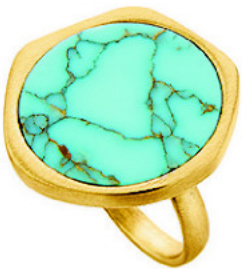
Δαχτυλίδι Li-LA-LO, www.lilalo.com