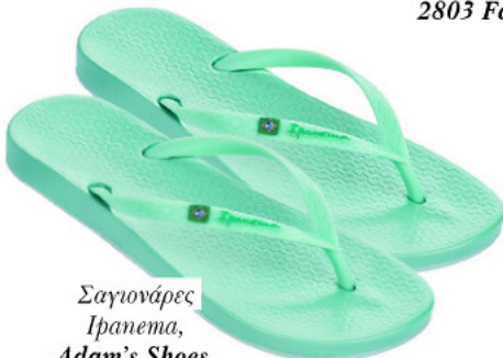
Σαγιονάρες Iranema, Adam's Shoes .