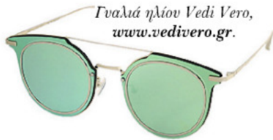
Γυαλιά ηλίου Vedi Vero, www.vedivero.gr .